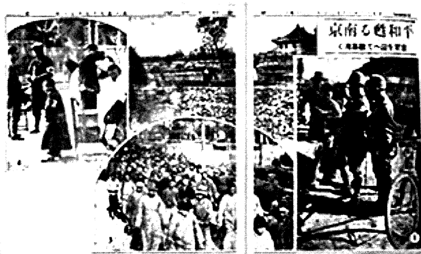
「昨日の敵に温情」 東京朝日新聞(12月22日号)